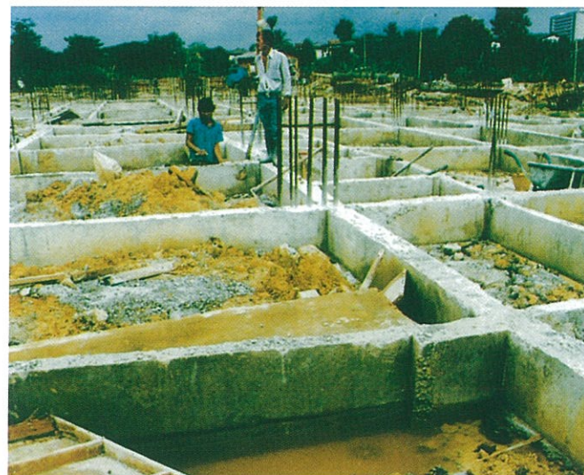
Tempat Pembiakan Nyamuk Aedes di Tapak Pembinaan (Contoh 1)

ABATE 500E sesuai untuk disemburkan pada permukaan air takungan di tapak pembinaan bangunan, parit atau tangki air kumbahan.