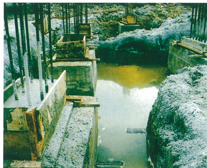
Tempat Pembiakan Nyamuk Aedes (Contoh 2)